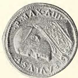
MÉDAILLE FRAPPÉE POUR COMMÉMORER LA VENUE DE L'AMBASSADEUR DU CONGO À ROME